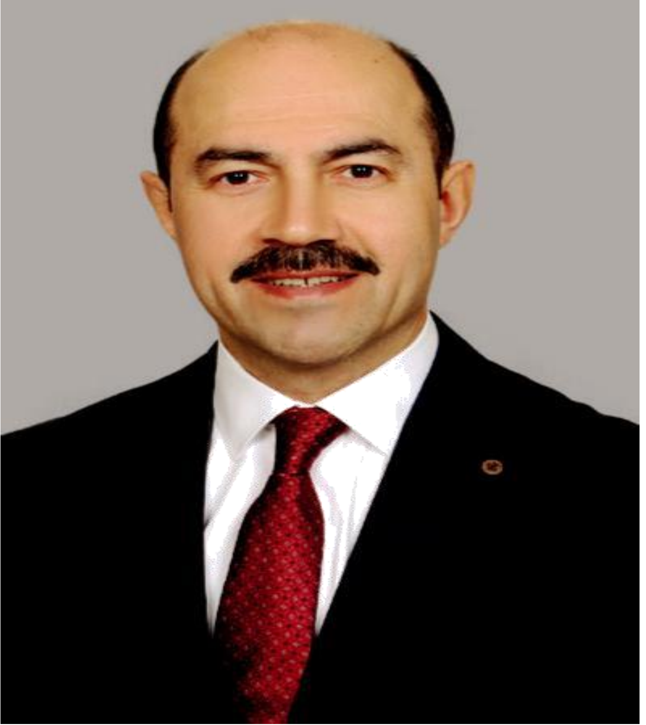
Ali KILIÇ Terme Belediye Başkanı