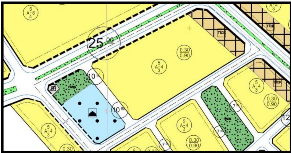
TEKLİF PLANLAR (1/1000 ÖLÇEKLİ UYGULAMA İMAR PLANI)